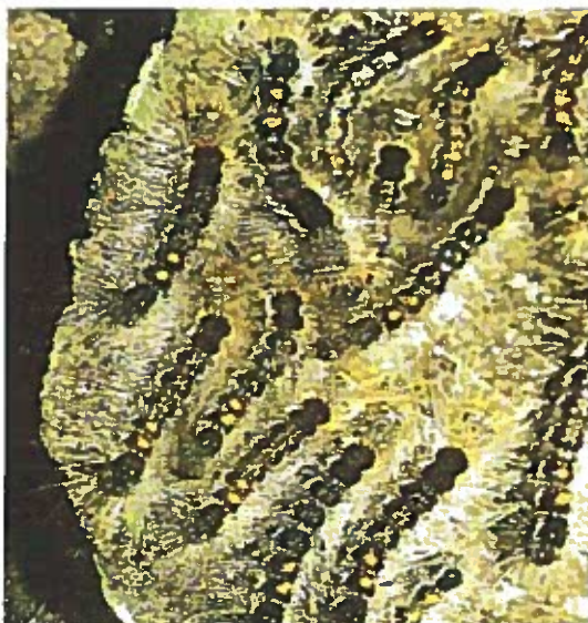
Giovani larve di E. Chrysorrhoea

Danni: le larve nascono e divengono attive nel pieno dell'estate, dalla fine di luglio alla metà di agosto. Hanno colore bruno nerastro, sono dotate di setole biancobruno (dalle proprietà urticanti) e sul dorso sono provviste di tubercoli color arancio. Ai lati del corpo si notano delle striature longitudinali bianco - arancio. Le larve manifestano tendenze gregarie. Le foglie delle piante ospiti (quercia, tiglio, acero, pioppo, carpino, rosacee e fruttifere varie) vengono ridotte alla sola nervatura. L'attacco determina dunque diffuse defogliazioni delle specie vegetali attaccate, che subiscono indebolimento e predisposizione ad altre malattie. Le modalità di lotta sono analoghe a quelle per Hyphantria Cunea .