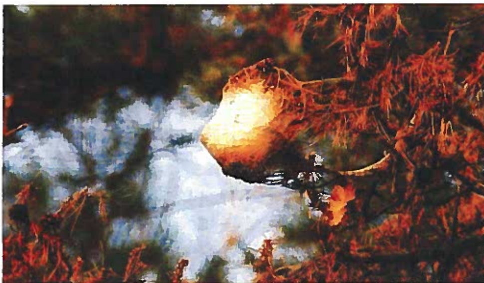
Nido di Thaumetopoea pityocampa.

In entrambi i casi lo scopo sarà quello di realizzare un ambiente sfavorevole ed inidoneo alla vita della processionaria durante il suo ciclo di sviluppo.