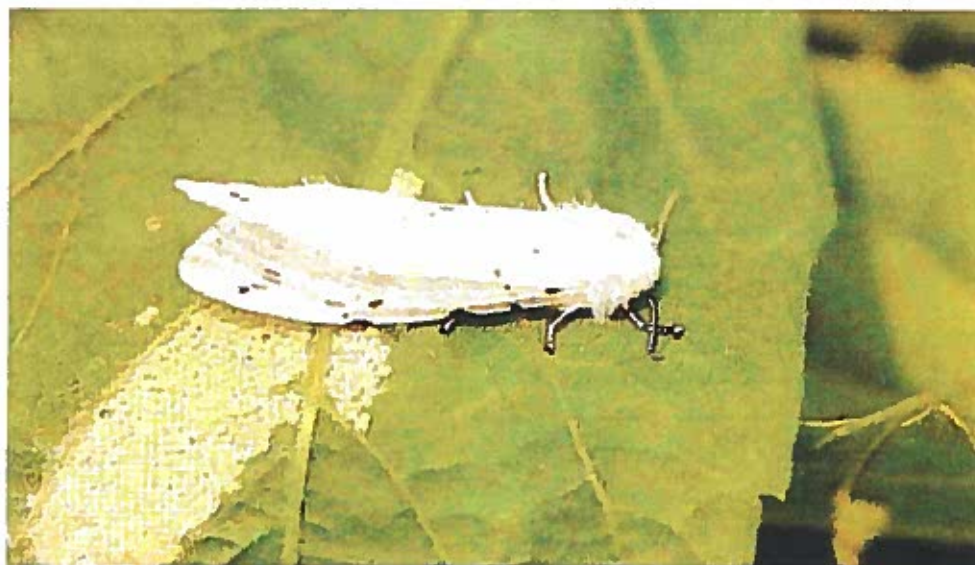
Adulto femmina di Hyphantria C. durante l'ovodeposizione.

I bruchi, raggiunta la maturità (in un mese circa) si mettono alla ricerca di adatti ricoveri: nel terreno, in un anfratto di tronco d'albero, in crepe nei muri, sotto le tegole delle abitazioni, per incrisalidarsi e svernare (larve della II generazione).