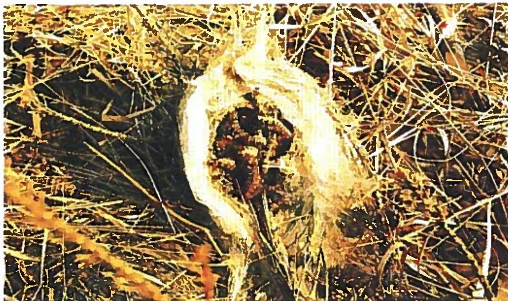
Nido aperto colmo di larve di processionaria del pino.

La processionaria è un insetto appartenente all'ordine dei Lepidotteri, le comuni farfalle. Durante gli stadi larvali (bruchi) le processionarie sono fitofaghe; si alimentano cioè delle parti verdi delle piante, provocando defogliazioni, indebolimento e blocco dell'accrescimento. Il riconosciuto potere molesto delle larve è dovuto alla presenza su di esse di numerosissimi peli urticanti che possono causare irritazioni e allergie cutanee all'uomo. Le popolazioni di processionaria sono soggette ad ampie fluttazioni cicliche, per cui si succedono periodi con sporadiche e modeste apparizioni a periodi con massicce infestazioni. Ciò avviene ogni 8 - 10 anni. Ci sono due specie di processionaria nella nostra penisola: la processionaria del pino ( Thaumetopoea pityocampa ) e la processionaria della quercia ( Thaumetopoea processionea ). Queste hanno un ciclo biologico diverso e in conseguenza di ciò i trattamenti, che devono essere effettuati sulle larve giovani, cadono per la processionaria del pino in agosto - settembre e per la processionaria della quercia in marzo - aprile.