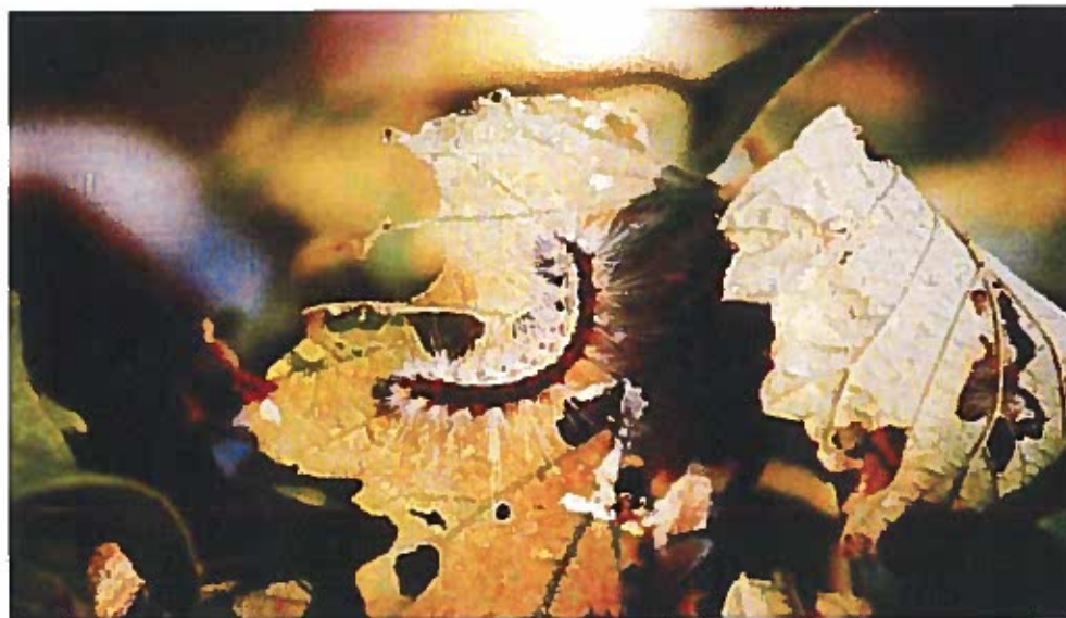
Larva di Hyphantria Cunea

Al centro - sud o nelle isole, si potrebbe anche giungere a tre generazioni l'anno.