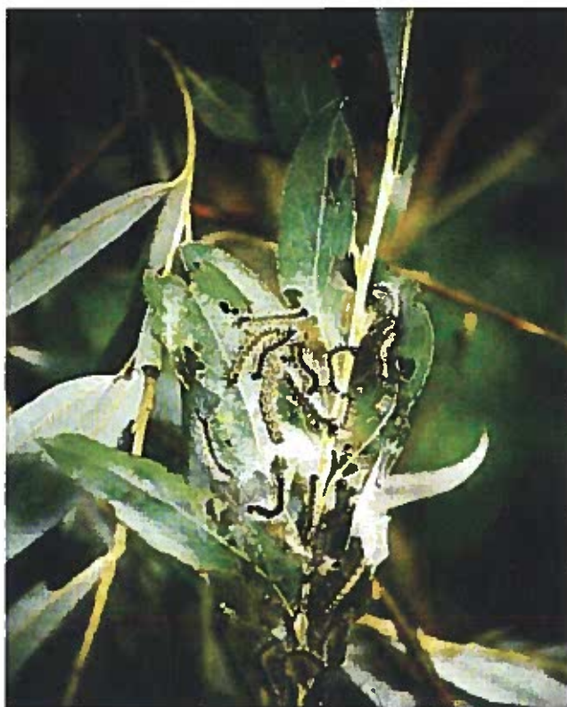
Larve di Hyphantria Cunea

le larve, estremamente polifaghe, provocano defogliazioni a carico di numerose specie, prediligono il gelso e l'acero negundo (che sono i primi ad essere attaccati). Noce, pioppo, platano, salice, tiglio, sambuco sono frequentemente colpiti e, nel caso di gravi infestazioni, anche ippocastano ed olmo, diverse specie di frutteti e di arbusti ornamentali possono essere danneggiati. Danni occasionali e solitamente contenuti si possono inoltre verificare sul finire dell'estate, a carico di coltivi di erba medica, mais e soia, attigui ad alberate intensamente defogliate.